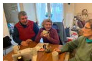
Un membre de l'équipe bénévole en compagnie de deux seniors.

adhérer à l'équipe bénévole, vous pouvez la contacter au 02.31.36.24.28 ou par mail : servicecivique.douvres@gmail.com Être membre de l'équipe bénévole... c'est quoi ? Les bénévoles assurent des visites de courtoisie au domicile des personnes âgées pour partager des moments de convivialité (échanges, jeux, goûter, balades...)